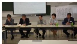
日本マンション学会学術大会in広島