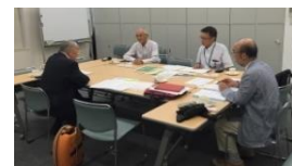
全管連構成団体視察 大阪